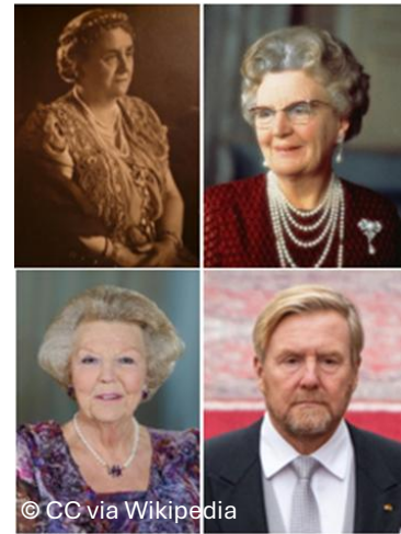
Wilhelmina, Juliana, Beatrix en Willem- Alexander

Op 4 september 1948 werd koningin Wilhemina opgevolgd door haar dochter Juliana. Vanaf dat moment werd Koninginnedag op 30 april gevierd. Dat was namelijk verjaardag van koningin Juliana. De oudste dochter van Juliana was Beatrix, geboren op 31 januari 1938. Zij werd koningin op 30 april 1980. In de jaren dat Beatrix koningin was, bleef Koninginnedag gevierd worden op 30 april, ter ere van Juliana.