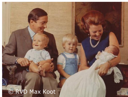
Willem-Alexander en zijn ouders en broers

Op de dag dat Willem-Alexander koning werd, was er ook geen normale Koningsdag. En daarna ging het nog 1 keer niet door. Maar als het wel feest is, dan viert hij het op 1 plaats in het land. Er zijn dan optredens van artiesten. En de koning en zijn familie doen mee aan spelletjes!