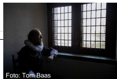
Hugo in de gevangenis