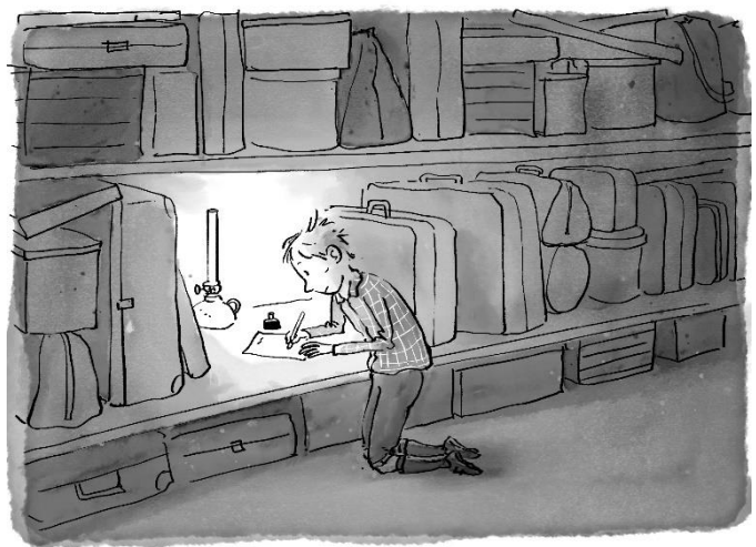
Illustratie: Iris Boter