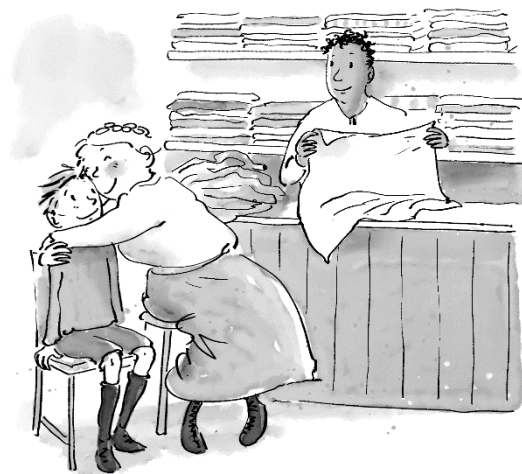
Illustratie: Iris Boter

7. Welk personage uit het boek had wat jou betreft geen rol in het verhaal hoeven spelen? Leg ook uit waarom je dit vindt.