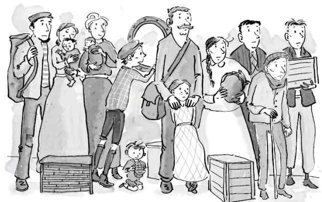
Illustratie: Iris Boter