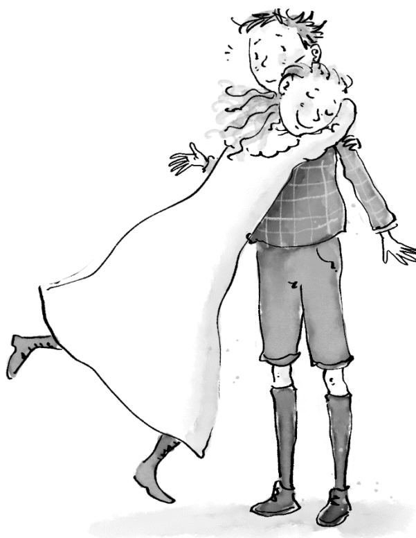
Illustratie: Iris Boter