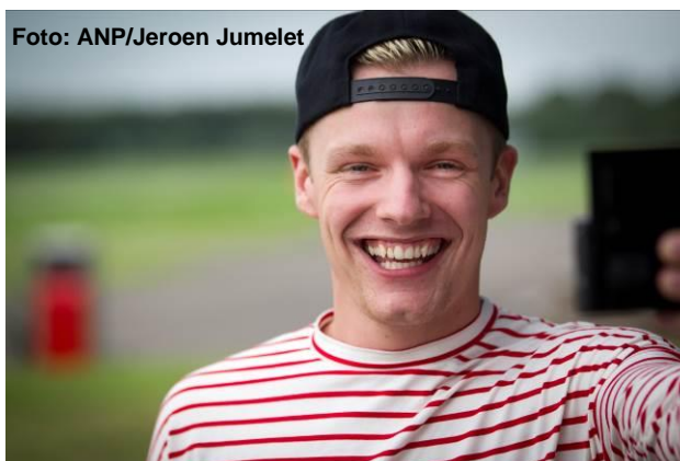
Enzo Knol maakt dagelijks vlogs die hij op YouTube zet