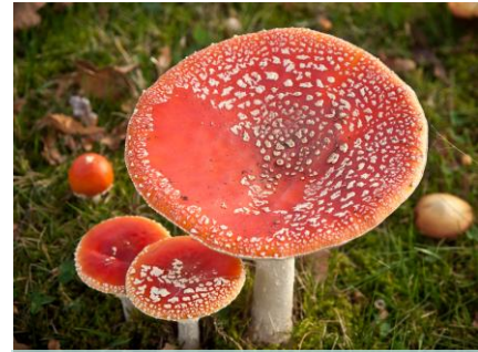
Pluk paddenstoelen niet zelf!

Bij het Nationaal Vergiftigingen Informatie Centrum (NVIC) komen vragen binnen over mensen die een paddenstoelenvergiftiging hebben. Vragen zoals, mijn kind heeft een hapje van een paddenstoel gegeten, wat moet ik doen? De vragen over paddenstoelenvergiftigingen zijn vaak seizoensgebonden. Paddenstoelen houden van een warme grond, een relatief hoge temperatuur en veel regen. Daarom zijn de meeste paddenstoelen in de herfst te vinden.