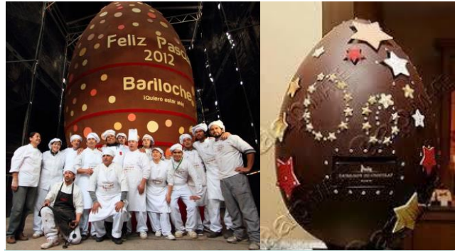
het grootste ei en het duurste ei ter wereld

Bij Pasen horen eieren, en vooral ook veel chocolade-eieren. Je ziet ze dan ook overal al in de schappen liggen. De meest verkochte eitjes zijn de standaard smaken melk, puur en witte chocolade. Maar er zijn ook heel bijzondere eieren. Zo werd in 2012 in Argentinië het grootste handgemaakte chocolade-ei ter wereld gemaakt. Dit ei was 850 cm hoog en woog maar liefst 7500 kilogram.