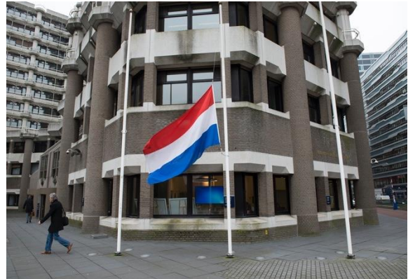
een vlag die halfstok hangt

Maar, wist jij dat er regels zijn voor het uithangen van de vlag? Die regels zijn er vooral voor de overheid en gemeentes. Mensen die thuis een vlag willen ophangen, hoeven de regels niet te volgen.