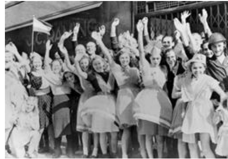
5 mei in het jaar 1945

4 en 5 mei zijn belangrijke dagen in Nederland. Weet jij waarom? Op 4 mei denken we aan de mensen die stierven in oorlogen. Op 5 mei vieren we dat Nederland vrij is. Er is geen oorlog meer in Nederland. Die dag heet Bevrijdingsdag. Nederland is lang geleden bevrijd. Dat gebeurde op 5 mei in het jaar 1945. Dat is nu 75 jaar geleden.