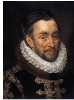
Willem van Oranje

Op 4 mei is het Dodenherdenking. Om 8 uur 's avonds is iedereen in Nederland 2 minuten stil. Na deze 2 minuten wordt het volkslied gezongen. Het volkslied van Nederland heet voluit Wilhelmus van Nassouwe . Het lied bestaat uit 15 stukjes. Elk stukje duurt ongeveer 2 minuten. De eerste letter van elk stukje is belangrijk. Wat gebeurt er als je al deze beginletters achter elkaar zet? Dan vormen ze de naam: Willem van Nassov. Zo schreef je vroeger Willem van Nassouwe Dat is een andere naam van Willem van Oranje. Zing jij op 4 mei mee?