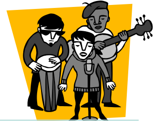
geluid van een rockband is 110 decibel

Doof of slechthorend worden heeft verschillende oorzaken. Bij sommige mensen zijn de botjes in het oor verschoven of is er sprake van een beschadiging aan de zenuwen. Dit kan leiden tot gehoorschade. Maar je kunt ook doof of slechthorend worden als je vaak en lang naar harde muziek luistert of te maken krijgt met harde geluiden (bijvoorbeeld herrie van machines).