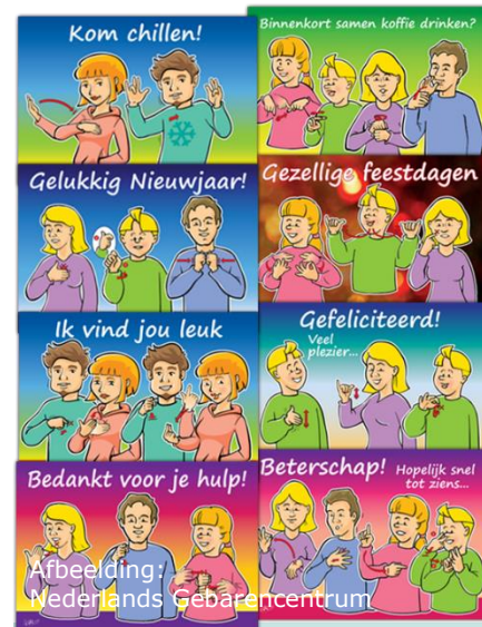
setje vrolijke kaarten met gebaren

Gebarentaal is bedoeld voor dove mensen. Zo kunnen zij praten met elkaar. Er zijn ook spullen met gebaren. Bijvoorbeeld boeken, films of spelletjes. Die kun je op internet bestellen. Hieronder zie je een lijst met spullen. Je ziet erbij hoe duur ze zijn.