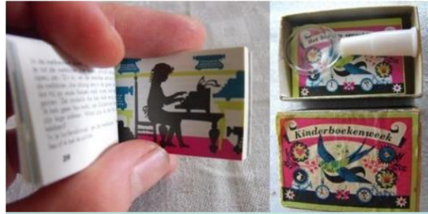
Het kleinste sprookjesboek

Een van de manieren om lekker thuis te ontspannen, is door een boek te lezen. Er zijn heel erg veel boeken. En er zijn natuurlijk ook speciale kinderboeken. Elk jaar is er ook een speciale Kinderboekenweek. Dan worden kinderboeken en de schrijvers ervan in het zonnetje gezet.