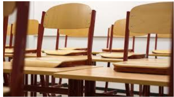
Scholen zijn dicht

De scholen en kinderdagverblijven blijven alleen open voor kinderen van ouders die in vitale beroepen werken, zoals in de zorg of bij de hulpdiensten. Zo kunnen die ouders gewoon aan het werk blijven.