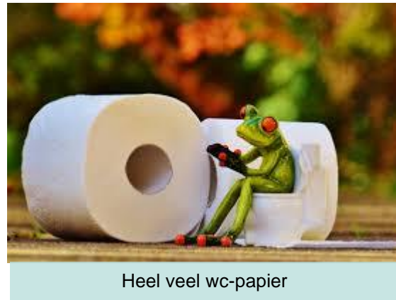
Heel veel wc-papier

Sinds de uitbraak van het coronavirus in Nederland zijn veel mensen in Nederland gaan hamsteren. Dit betekent dat ze plotseling heel veel zijn gaan kopen. Er is veel rijst, pasta, pastasaus en blikgroente verkocht. Naast eten wat lang houdbaar is, is er ook een run in de supermarkten op wc-papier. Opeens zijn de schappen voor het toiletpapier leeg. Volgens de overheid en de supermarkten is dit helemaal niet nodig, er is namelijk genoeg voor iedereen en ook voor lange tijd. Waarom mensen zoveel toiletpapier kopen weet niemand.