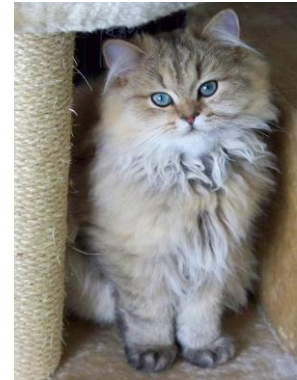
een Perzische kat

In de tabel hieronder zie je wat een kat in totaal ongeveer kost.