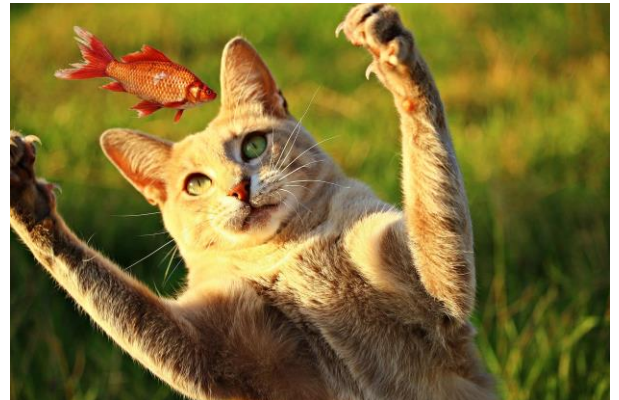
Een kat vangt een vis.

Hieronder zie je in de tabel hoeveel prooien in Nederland er volgens het onderzoek in 2015 ieder jaar gemaakt worden door katten.