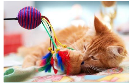
speelgoed voor de kat

Een kat kost geld. Een kat moet eten, net als jij. Af en toe gaat een kat naar de dierenarts. Hij heeft ook een kattenbak nodig. Het is ook leuk wanneer de kat speelgoed heeft. En wat denk je van een krabpaal?