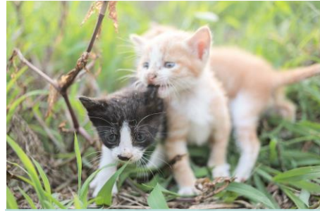
De kittens oefenen met jagen.

Een baby van een kat noem je een kitten. Een kitten kan nog niet meteen jagen. Hij moet eerst nog andere dingen leren. Als de kitten 8 weken is, oefent hij met jagen. Hier lees je hoe een kat groeit.