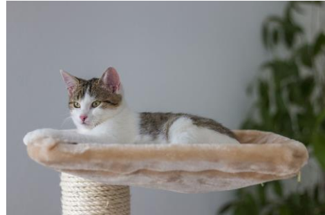
een kat in een krabpaal

Ook heeft de kat een eigen wc: de kattenbak!