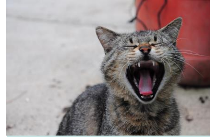
Een kat heeft scherpe tanden en sterke kiezen

Hieronder in de tabel zie je welke tanden en kiezen een kat heeft. En ook hoeveel hij er heeft. Daarnaast zie je een tabel met de tanden en kiezen van een kind van 10 jaar.