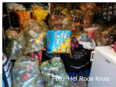
tassen met lege flessen