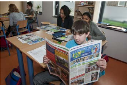
Kinderen lezen de krant

3. Bij de tekst staan twee plaatjes . Waarom denk je bij deze plaatjes?