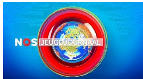
Wat komt in het Jeugdjournaal?

4. De tekst heeft drie kopjes . Waar denk je aan bij deze kopjes? Wat weet je er al over? Schrijf het op in het schema hieronder en op de volgende bladzijde.