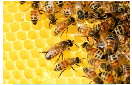
Bijen worden bedreigd

Bedreigde diersoorten leven niet alleen in oerwouden en bossen in het buitenland, maar ook in Nederland. Uiteraard gaat het dan niet over mensapen, olifanten of panda's, maar wel over bijvoorbeeld bijen, vlinders en vliegen.