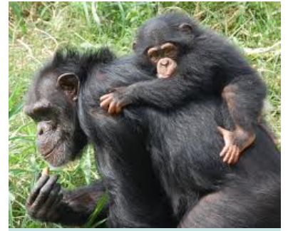
Chimpansee met baby

Je hebt vast weleens een mensaap gezien. Gorilla's en chimpansees zijn mensapen. Ze lijken wel een beetje op ons. Maar er zijn ook grote verschillen! Een vrouwtjes-aap krijgt haar eerste baby als ze 12 jaar is. Na 5 jaar krijgt ze pas een tweede baby. Een jong blijft 8 jaar bij zijn moeder. Dan gaat hij in een nieuwe groep leven. Die groep bestaat uit 10 mensapen. Een mannetje, 3 vrouwtjes en kleintjes.