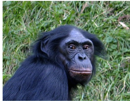
Een bonobo in het wild

Organisaties zoals het Wereld Natuur Fonds en Stichting AAP zetten zich in om de apen te redden.