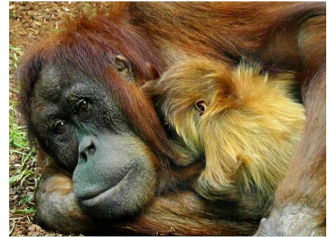
Een orang-oetan met baby

De soorten verschillen veel van elkaar, ook in lengte en gewicht.